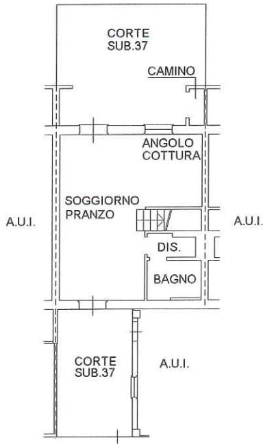
PIANO TERRA H=2.74